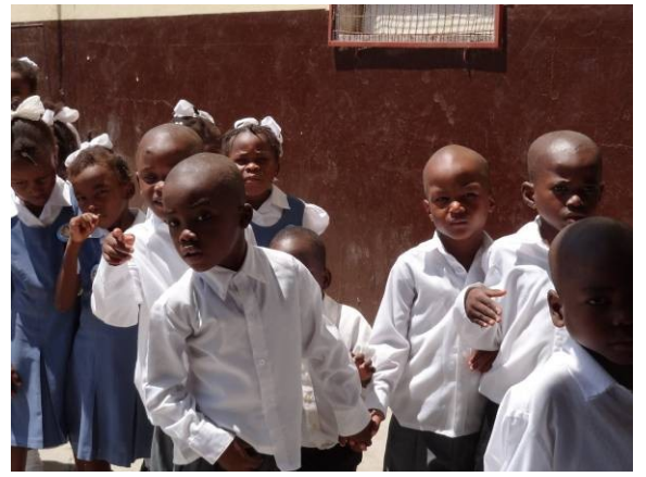
Enfants recueillis chez les Sœurs Lassaliennes, messe du Dimanche

Se pose le problème de l'avenir de ces enfants, qui ne sont pas adoptables, d'autant plus que les Sœurs commencent à manquer sérieusement de fonds.