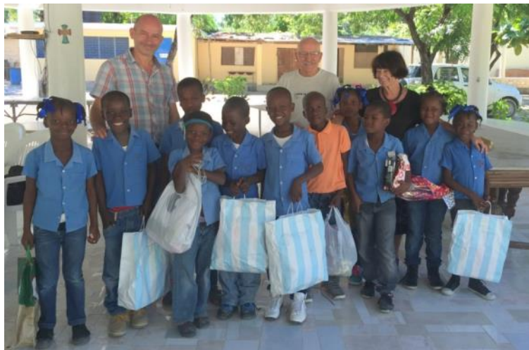
Les enfants parrainés de l'école de Lamardelle

Nous sommes passés cette année de 9 à 13 parrainages d'enfants de l'école de Lamardelle . Nous cherchons 10 autres parrains pour cette structure très bien organisée.