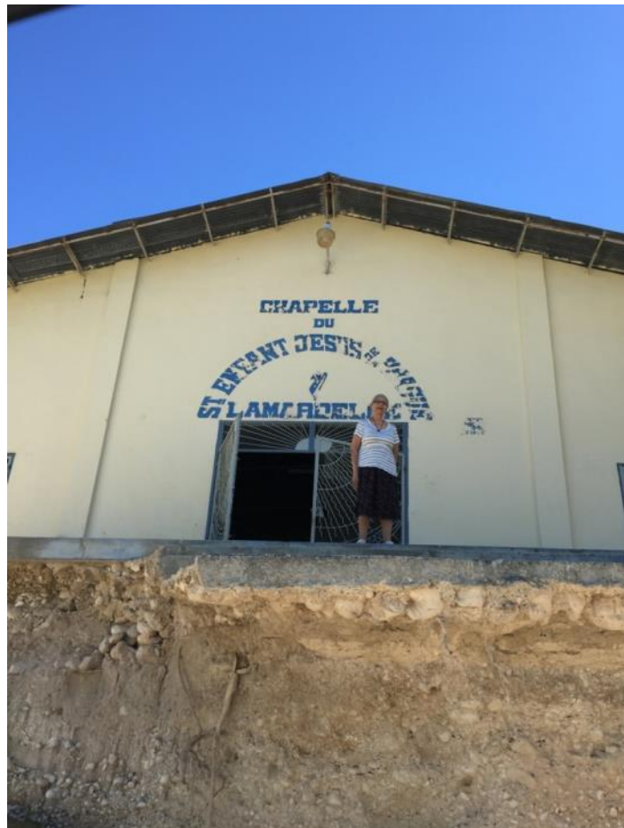
La chapelle comme la clinique sont désormais au bord du ravin laissé par l'ouragan

La clinique est à nouveau fonctionnelle depuis Janvier 2016. La route qui la jouxte a été une nouvelle fois inondée lors de l'ouragan, et il va falloir construire un mur de soutènement car les bâtiments sont menacés par une nouvelle crue.