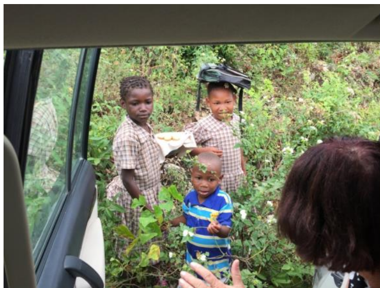
Au milieu de nulle part...